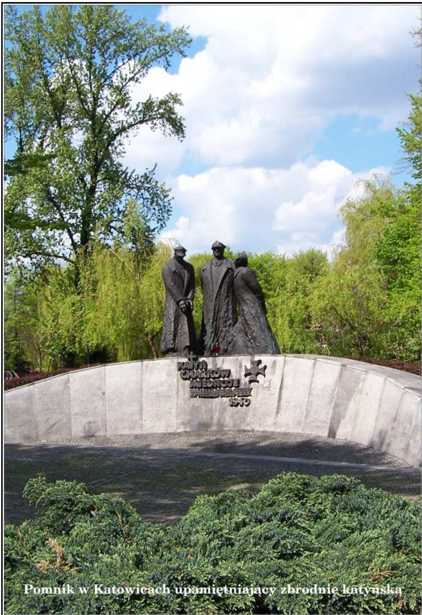
Pomnik w Katowicach upamiętniający zbrodnię katyńską